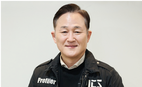
프로파일러 표창원 소장

아래 3인의 인터뷰 중 관심있는 직업인 1명을 선택하여 아래 내용을 적어보세요.